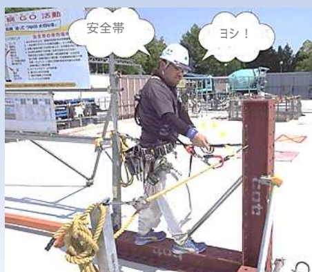
試行ゲートで点検と訓練

二丁掛け墜落制止用器具を基本に、高所作業における墜落時の衝撃を緩和するフルハーネス型墜落制止用器具の使用を徹底する。