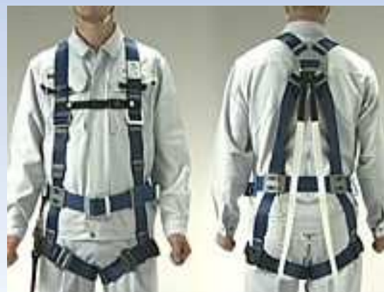
フルハーネス型墜落制止用器具