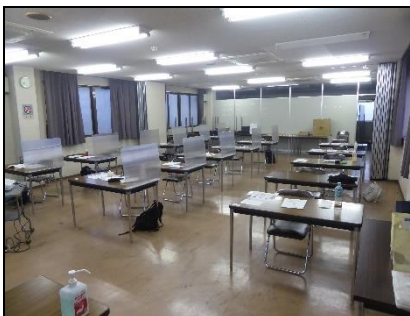
講義会場での 受講者の座席間隔

また、その後、会員事業場様より開催希望があり令和3年12月に追加開催をいたしました。