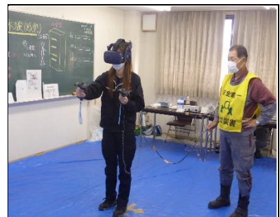
VR（仮想現実）技術を活用 した感電災害のリアル体感