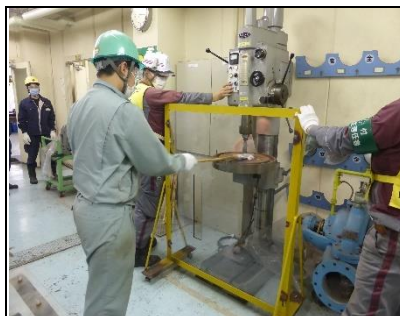
ボール盤での 巻き込まれ災害の危険体感