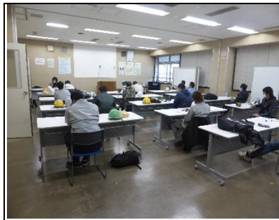
実技会場でのワイヤー ロープ選定の試験前風景