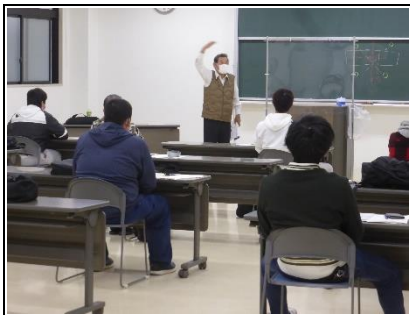
学科会場での 玉掛け合図の学習風景

なお、令和4年3月の開催は、学科は3月17日（木）～18日（金）、実技は3月20日（日）の日程で、受講申込を受け付けておりますのでよろしくお願いいたします。